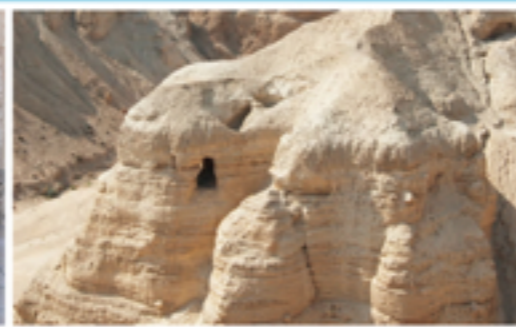
3 Qumran: la località sulle rive del Mar Morto nella quale nel 1947 furono rinvenuti antichi rotoli della Bibbia.