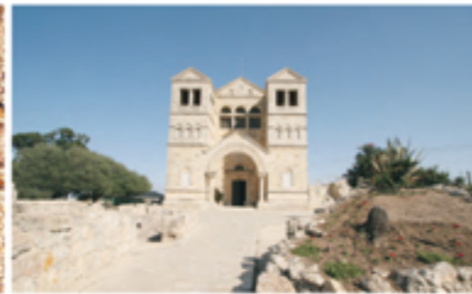
9 Monte Tabor: la Basilica costruita sul luogo nel quale sarebbe avvenuta la Trasfigurazione di Gesù.