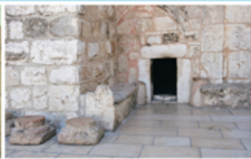
2 Betlemme: entrata della Basilica della Natività, costruita ai tempi dell'imperatore Giustiniano.