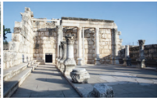
5 Cafarnaon: i resti dell'antica sinagoga nella quale secondo il Vangelo di Marco Gesù iniziò la sua missione.