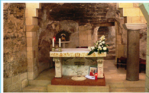
1 Nazareth: la grotta nella cripta della Basilica dell'Annunciazione, luogo dell'antica abitazione di Maria.