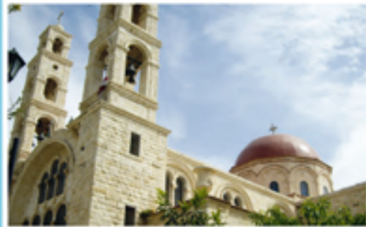
7 Sycar: la Chiesa greco-ortodossa nella quale secondo la tradizione si trova l'antico pozzo di Giacobbe.