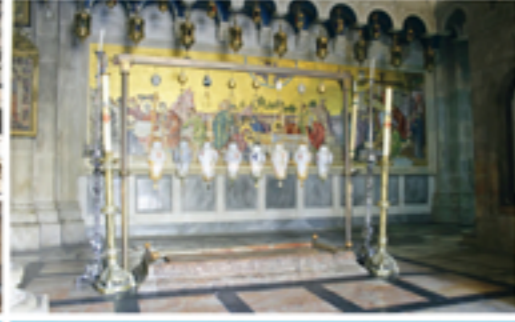
11 Gerusalemme: la pietra dell'unzione nella Basilica del Santo Sepolcro, sulla quale fu posto il corpo di Gesù.