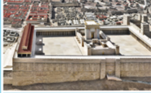
10 Ricostruzione tridimensionale del tempio di Salomone a Gerusalemme, attorniato dall'ampia spianata.