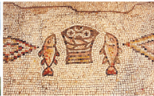
8 Tabga: il mosaico scoperto sulle rovine del primo Santuario della moltiplicazione dei pani e dei pesci.