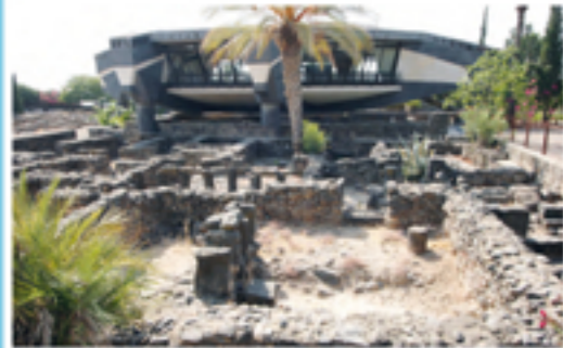
4 Cafarnaon: la "Domus Ecclesiae" a pianta ottagonale costruita sull'antica casa di Pietro.