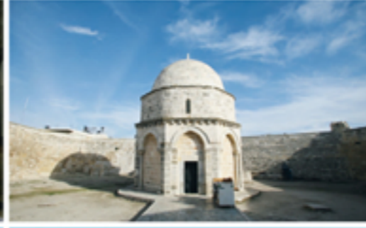
12 Gerusalemme, Monte degli Ulivi: il Tabernacolo costruito dove si ritiene avvenuta l'Ascensione di Gesù.